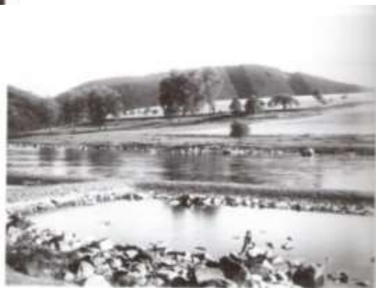
Podílná kamenná hráze a příčkami tvořící přehradu "Břehy" u Břehů.