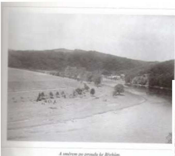
A směrem po proudu ke Břehům.