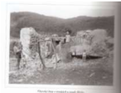
Řopík v okolí Kamýcké přehrady.

Břehů se dotklo období 2. světové války a takzvaná Vltavská obranná linie, která měla velmi krátké trvání. Vltavská linie byla vybudována narychlo a za těžkých podmínek v roce 1938, kdy byly po březích Vltavy budovány obranné betonové pěchotní objekty, takzvané „řopíky“ (podle ŘOP – ředitelství opevňovacích prací), s úkolem poskytnout případnou ochranu armádě při plánovaném ústupu ze západu na východ. Plány staveb i okolnosti jejich budování byly přísně tajné. Betonáž se prováděla naráz, aby odolnost řopíku nebyla narušena dilatační spárou. Betonovalo se ve dne i v noci za svitu petrolejových lamp, míchačky byly poháněny diesellovými motory, od nichž byl beton navážen v kolečkách na lešení a ručně pěchován do bednění. Některá místa byla těžko dostupná, tak se beton a další stavební materiál přivážel na místa loděmi. Do vývoje 2. světové války nakonec pevnůstky příliš nepromluvily a nebyly k obraně vlastní využity. Díky vzniku protektorátu Čechy a Morava však byly objekty na příkaz Němců již v roce 1939 systematicky likvidovány. Po březích postupovaly stavební čety, které obranné objekty odstřelovaly a následně rozebíraly. Železobetonové monolity napěchované náložemi však často pouze „nadskočily“ a opět si sedly. Kýžený efekt přineslo až umístění trhaviny ve střílnách a v rozích objektu. Díky tomu se po detonaci převrátila střecha a stěny se rovnoměrně rozevřely do stran.